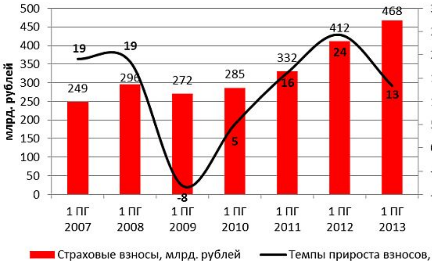
Рис. 1. Динамика страховых взносов

годом на 13%. Итоговый прогноз скорректирован вниз на 2 п.п. с учетом более сильного замедления роста корпоративного сегмента. В то же время положительное влияние на динамику взносов окажет восстановление программы льготного автокредитования с 1 сентября 2013 года. Активно будут развиваться новые каналы продаж – продажи через нестраховых посредников и Интернет.