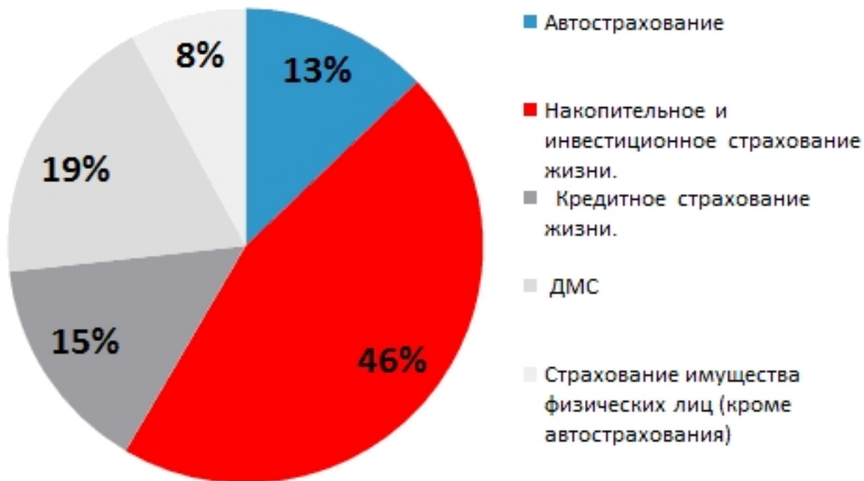
Рис. 1. Какой из перечисленных сегментов будет расти быстрее других в 2015 году?