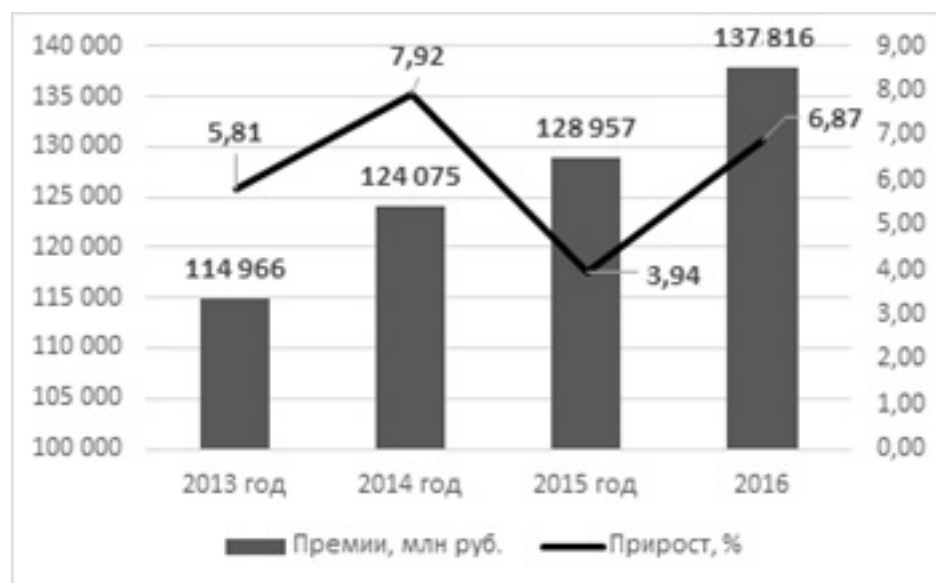
Рис. 1. Динамика премий по ДМС в 2013–2016 гг.